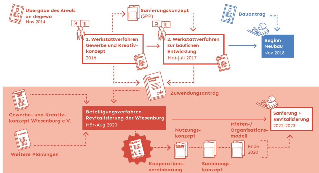
Abb. 1: Überblick Gesamtprozess

Im Prozess zur Revitalisierung des Areals gilt es, alle Beteiligten miteinzubeziehen und die verschiedenen Vorstellungen, Wünsche und Ideen für die Entwicklung zu diskutieren und zusammenzubringen. Das Beteiligungsverfahren zum Nutzungskonzept baut auf vorangegangenen Werkstattverfahren auf, in denen bereits die Weiterentwicklung des Areals und die benachbarte Neubebauung thematisiert wurde. Die hier getroffenen Übereinkünfte dienen als Grundlage und fließen in das weitere Verfahren mit ein.