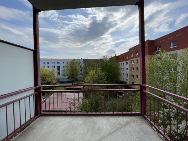
Zimmer 2 Balkon