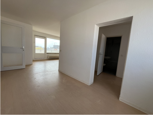
Zimmer 1 (2)