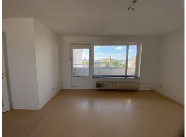
Zimmer 1 (3)