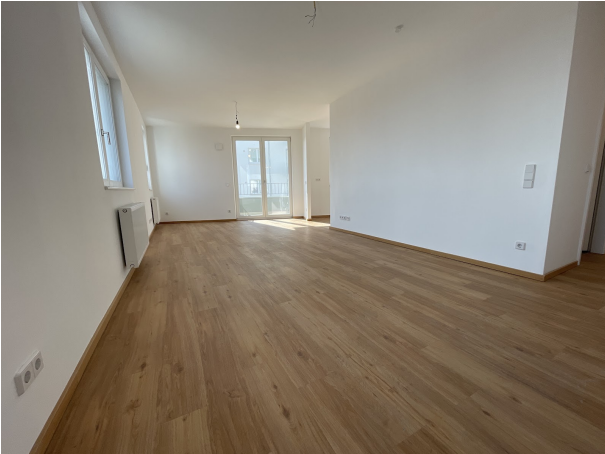
Zimmer 1 Ansicht 1