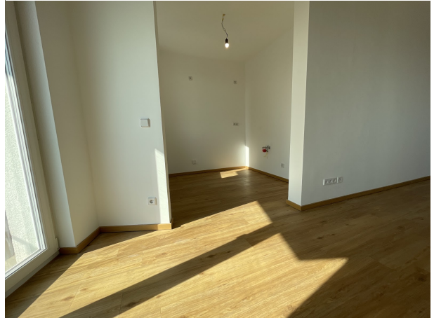
Zimmer 1 Küche