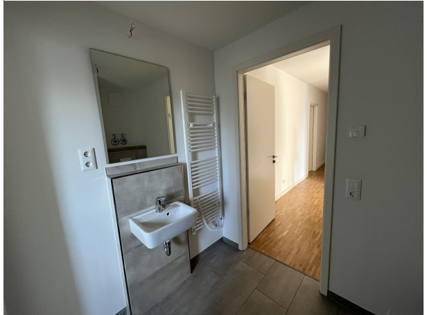
Bad 1 (2)