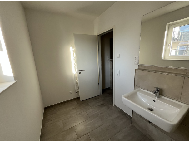
Bad 2 (1)