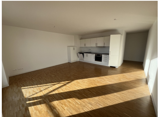
Zimmer 4 (1)