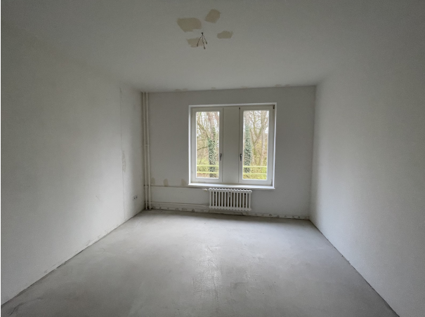
Zimmer 2 1