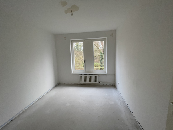
Zimmer 1 1