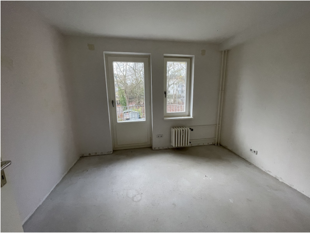
Zimmer 4 1