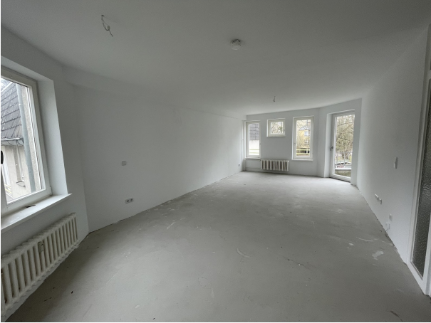
Zimmer 3 1