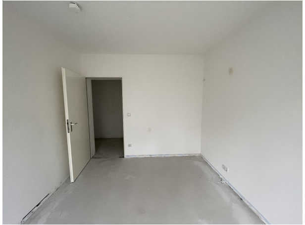
Zimmer 1 2