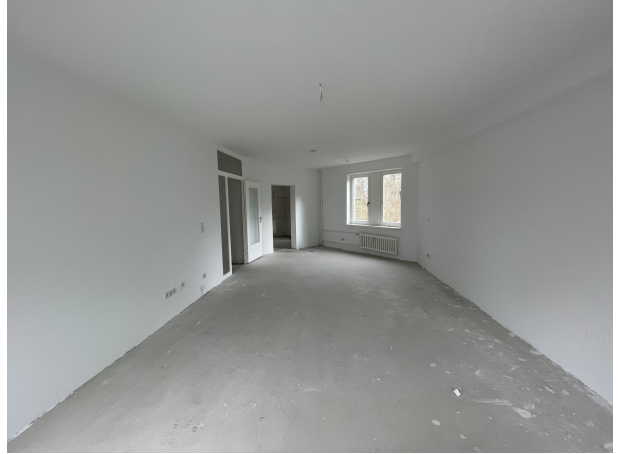
Zimmer 3 2